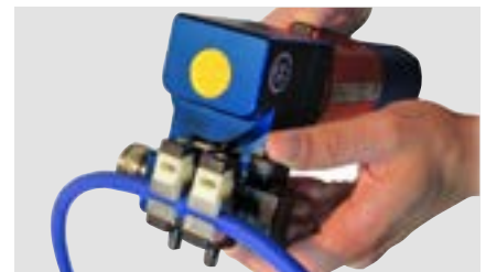
Máquina de soldadura por fricción