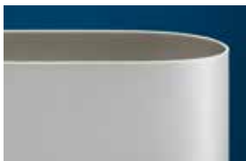
Ropanyl Premium band