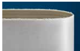
Gelijkwaardige band van een concurrent

*resultaten behaald na identieke laboratoriumtesten