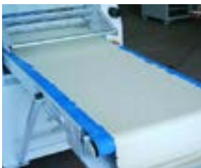
Nouvelle bande Ammeraal Beltech bleu clair