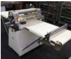
Bande blanche traditionnelle